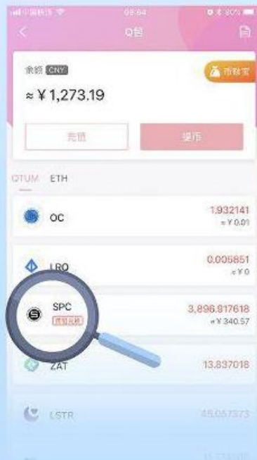
第2步 点击spc下的跨链兑换按钮