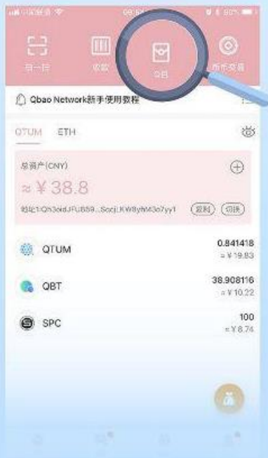
第1步 需要兑换的spc充值到Q包