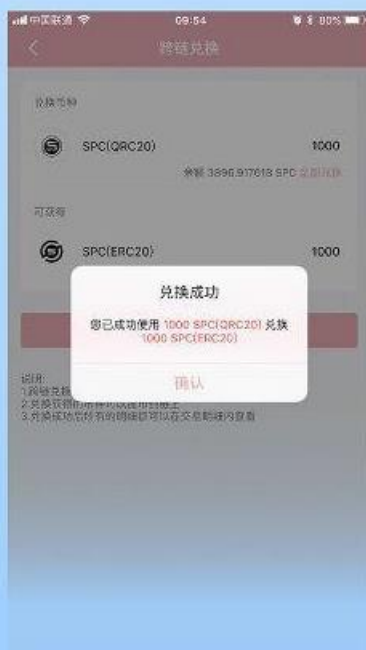
第3步 输入需要兑换的数量