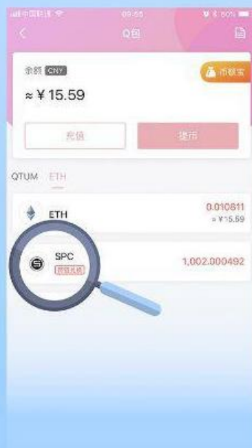
第4步 切换到Q包内ETH查看即可